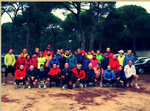
Participantes 1ª edición Trotada Sinfónica

Por descontado, al mismo tiempo que se enviaba este correo, salía otro dirigido a todos aquellos que habían participado el año pasado. Objetivo: daros información,